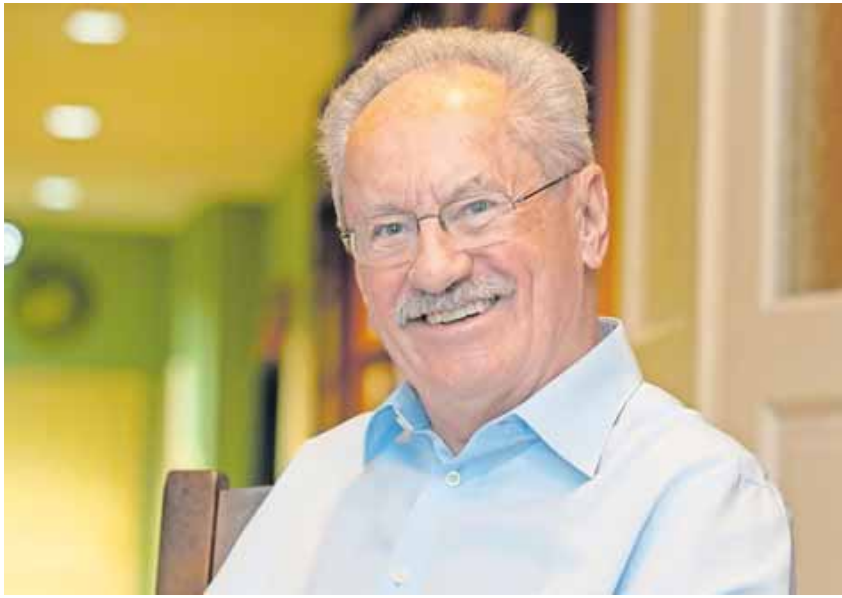
Alt-Oberbürgermeister Christian Ude pflegt enge Kontakte zu Juden und Muslimen.