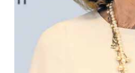
Kritik am Zufluchtsort der Juden kommt für Charlotte Knobloch nicht infrage.

Er sieht darin eine Gleichsetzung von Israel mit dem Judentum, und das führe nur zu mehr Antisemitismus. „Kritik an Israels Regierung wird schnell als antisemitisch abgestempelt.“ Der Antisemitismus-Vorwurf werde instrumentalisiert, auch gegen Palästinenser und ihre Forderung, selbstbestimmt in Freiheit und Gerechtigkeit zu leben. Obwohl es vor allem um die